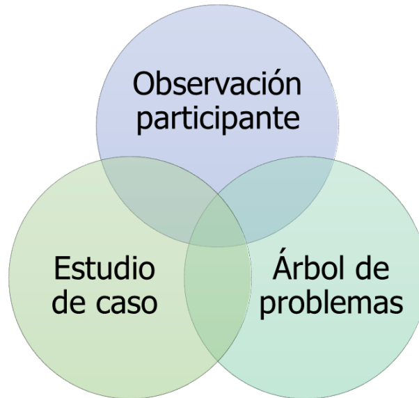
Figura 2. Técnicas cualitativas.