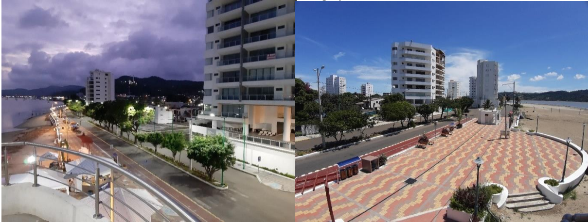
Figura 2. Vista panorámica de la playa “Paseo Roberto”

Esta playa tiene una extensión aproximada de 1400 metros los cuales 600 metros que le pertenecen a la playa frente al estuario del río sin olas, y del otro costado los 800 metros que se encuentra al frente del océano pacífico en donde se pueden evidenciar la presencia de olas y puesta del sol.