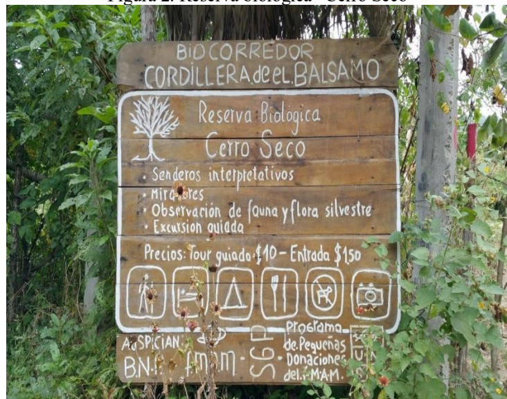
Figura 2. Reserva biológica "Cerro Seco"

Correspondiente a la cita mencionada anteriormente podemos indicar que este lugar contiene una diversidad de enorme flora endémica entre las más principales especies están palo santo, moyuyo, guayacán entre otros. No obstante, también posee considerables números de aves que solo pueden ser observados en las mañanas, esta reserva se encuentra protegida por las personas que habitan en el lugar, cerro seco brinda posibilidad de trabajo como también proyectos de investigación.