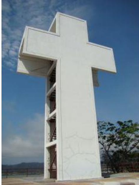
Figura 3. Mirador "La Cruz"