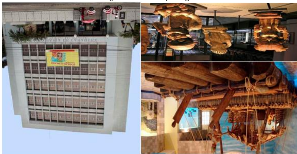
Figura 1. Museo arqueológico

Está ubicado en el centro de la ciudad en el malecón Alberto F. Santos, cuenta con cinco pisos, tres pisos de exhiben las diferentes arqueologías y artes visuales. Cuentan con personal altamente calificado, en varios tipos de idiomas que hace que la visita tanto local como extranjera sea agradable. En la actualidad se encuentra en restauración.