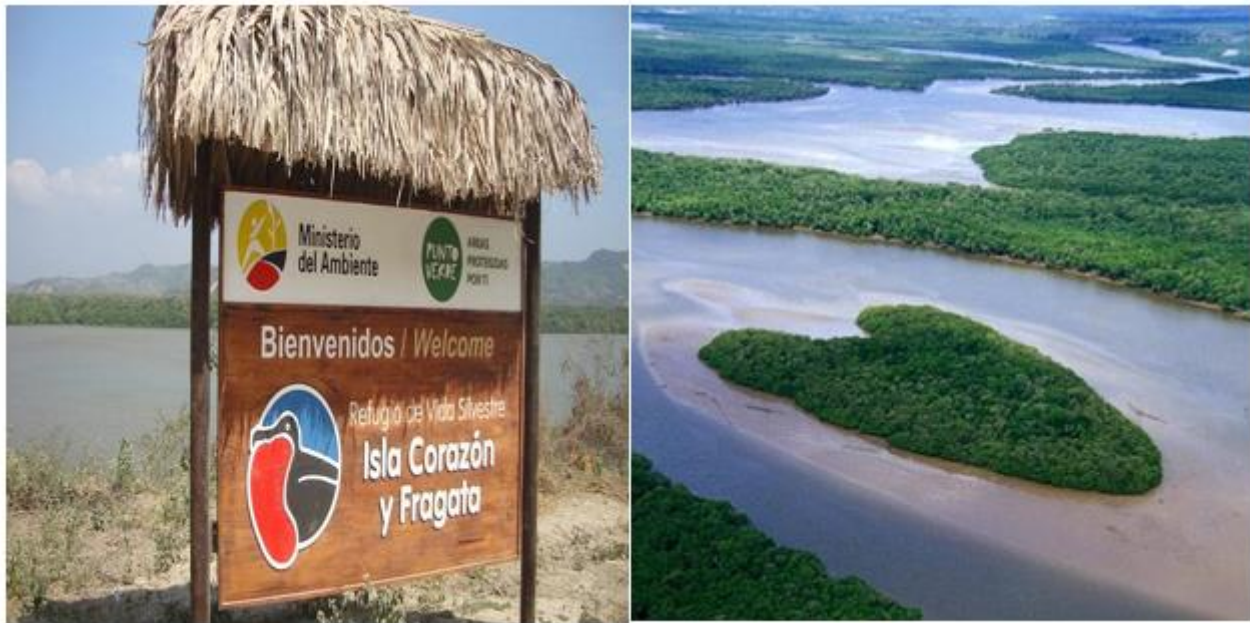
Figura 4. Atractivo refugio de vida silvestre Isla Corazón y Fragatas

Más de 60 especies de aves entre nativas, migratorias han sido identificadas dentro de la isla durante las diferentes épocas del año, pero entre ellas las más comunes están ibis, garzas nocturnas garzas, garzas níveas, garzas reales, garzas bulleras, cormoranes, tórtolas, garcillas estriadas, mariposas, murciélago blanco, martín pescador grande y martín pescador verde, zarapitos trinadores, agujetas, entre otros. También se encuentran otras especies como iguanas, la boa constrictor, y una amplia variedad de crustáceos, moluscos y curiosos insectos. Allí se encuentra una de las colonias más grandes de aves fragatas del Pacífico. Esta colonia se triplicó en los últimos 8 años, gracias a la reforestación y rescate del manglar, así como otras especies endémicas que a programas de vida silvestre se han rescatado.