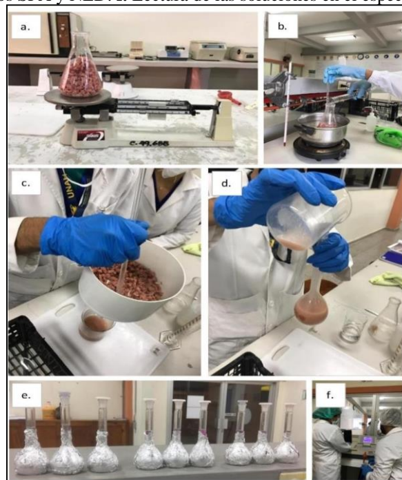
Figura 1. Procedimiento realizado. a. Fraccionamiento y pesado de la muestra. b. Digestión de la muestra. c. Filtrado de la muestra. d. Trasvaso de la muestra a un matraz volumétrico. e. Reposo de la muestra por 15 minutos después de agregados los reactivos SFA y NED. f. Lectura de las soluciones en el espectrofotómetro.

Para la preparación del estándar de nitrito se empleó 500 mg en 1000 mL de agua destilada, se tomó 1 mL de la solución y se adicionó 2.5 mL de SFA (Sulfanilamida) y 2.5 mL NED (1-Naftiletildiamina), se aforó con agua destilada en un matraz volumétrico de 100 mL. El blanco se preparó a partir de 20 mL de agua destilada y las soluciones SFA y NED a las mismas concentraciones que los estándares anteriores. Finalmente, las soluciones estándares se dejaron reposar durante 15 min, para su posterior lectura por triplicado en el espectrofotómetro a una longitud de onda de 540 nm (Figura 1).