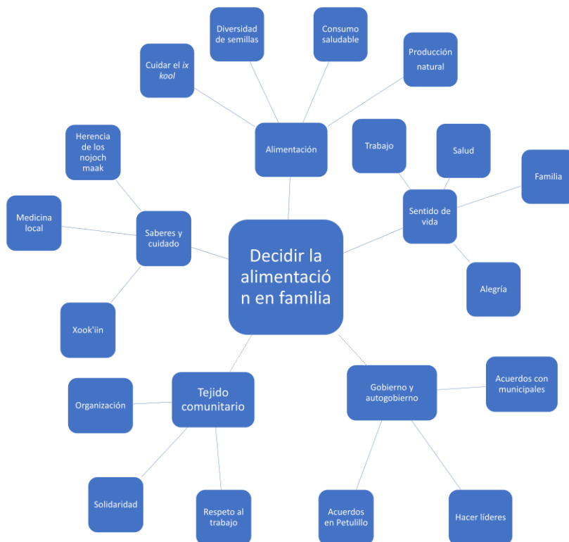
Figura 2: Propuesta de componentes de la autonomía alimentaria familiar

La segunda propuesta generada desde el diálogo del grupo de la academia con la comunidad y la participación comunitaria, permitió obtener un esquema detallado de componentes que sería la base para el diálogo con los expertos líderes del Estado, que se muestra en la figura 2.